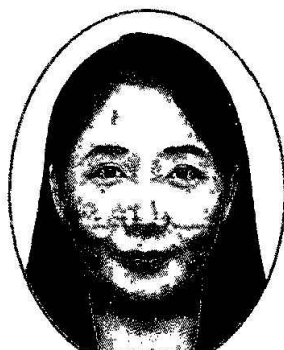
國立屏東科技大學 食品科學系 助理教授