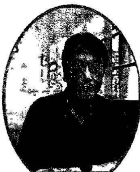
國立屏東科技大學 食品科學系 副教授