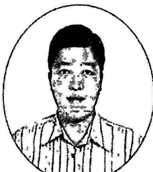
國立臺灣海洋大學 食品安全與風險管理研 究所/助理教授