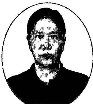
環球科技大學 生物技術系 副教授/退休