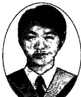
國立台東大學 食品生物技術應用二年制 在職學位學程/助理教授